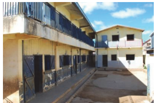
La cour de l'EPP d'Anosizato Andrefana

Quelques enseignants de l'EPP, défrayés par AFEM NSAM, donnent des séances de 2 heures de soutien scolaire , ouvertes à tous les élèves de l'école mais obligatoires pour les Elèves Accompagnés. Le bénéfice de ce soutien scolaire pour les EA n'est pas vraiment satisfaisant puisque 17 d'entre eux n'ont pas réussi leur année. Il faudrait peut-être envisager de donner deux séances d'une heure plutôt qu'une séance de deux heures, compte tenu de la fatigue des enfants en fin de journée. Comme les années précédentes, le suivi médical des EA est assuré.